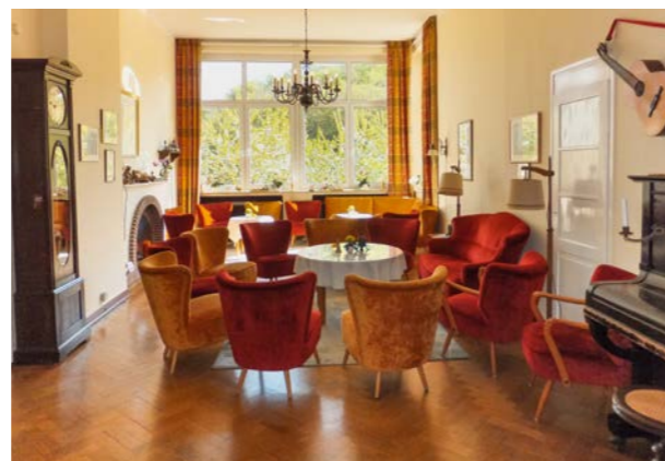
Gemütliche Atmosphäre im Kaminraum

Gruppen, die bewusst das Besondere suchen, finden im Haus Salem eine preiswerte Möglichkeit. Es gibt 14 Einzel- und 10 Doppelzimmer mit der Möglichkeit, Betten zuzustellen. Etagen-Duschen und -Toiletten sind in ausreichender Zahl vorhanden. 5 Zimmer verfügen über ein eigenes Bad.