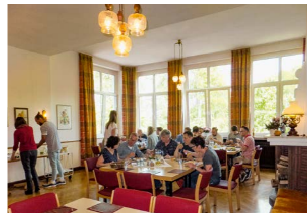
Tischgemeinschaft im Speisesaal

Haus Salem ist ein Bethel-Haus mit christlicher Prägung. Dafür steht die Wald-Kapelle oberhalb des Hauses. Sie lädt ein zu Andachten, Meditationen und zum Beten mitten in der Schönheit von Gottes Schöpfung.