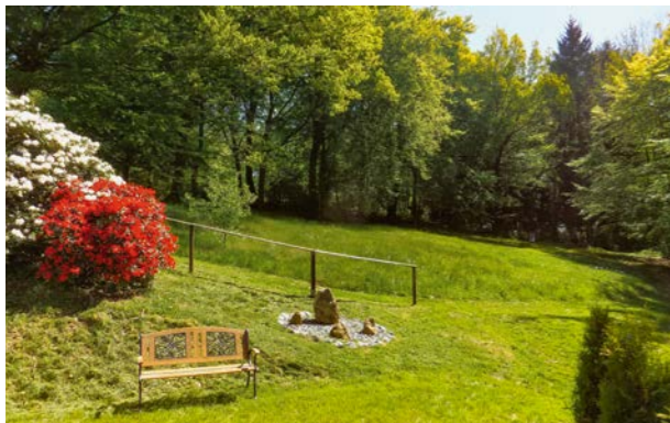
Wald- und Wiesengelände

Gegen Aufpreis kann das ganze Haus von einer kleinen Gruppe allein belegt werden.