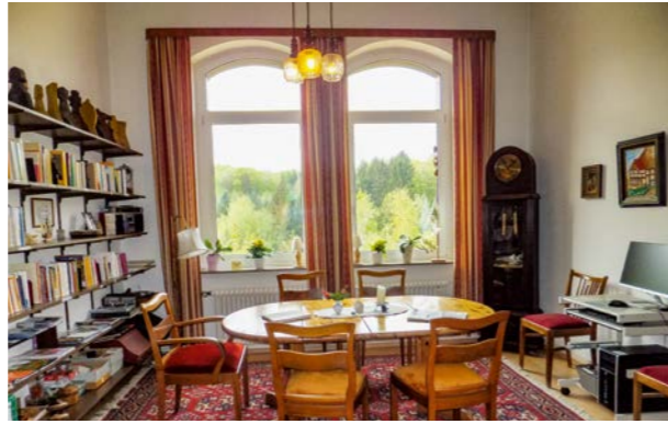
Bibliothek mit Gäste-PC